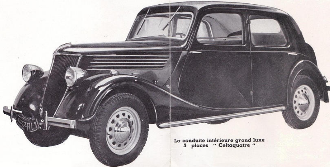
La conduite intérieure grand luxe 5 places " Celtaquatre "

La largeur intérieure de la CELTAQUATRE atteint 1 m. 31. L'utilisation de la totalité de la largeur de la carrosserie réserve 3 places sur le siège arrière et 2 vastes places sur le siège avant. La fameuse suspension en 3 points, complétée par 4 amortisseurs hydrauliques puissants, assure un confort incomparable et une tenue de route magnifique. Les bagages sont à l'abri du vol et de la poussière, dans un coffre intérieur de grande dimension, ou dans une malle à double accès.