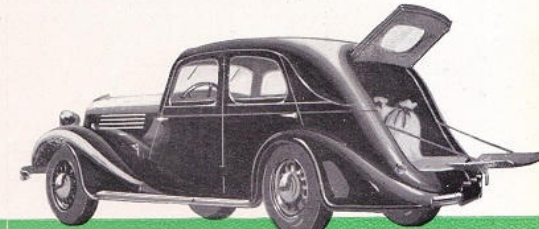
La conduite intérieure commerciale

LA NOUVELLE " CELTAQUATRE " EST LIVRÉE AVEC LES CARROSSERIES SUIVANTES :