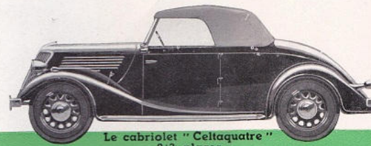
Le cabriolet " Celtaquatre " 2/3 places