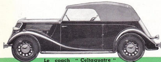
Le coach " Celtaquatre " 5 places

DANS LA "CELTAQUATRE" TOUT A ÉTÉ CONÇU EN VUE DU RENDEMENT DE LA VOITURE, DE L'AGRÈMENT DES PASSAGERS ET... DU FAIBLE CÔÛT D'EXPLOITATION.